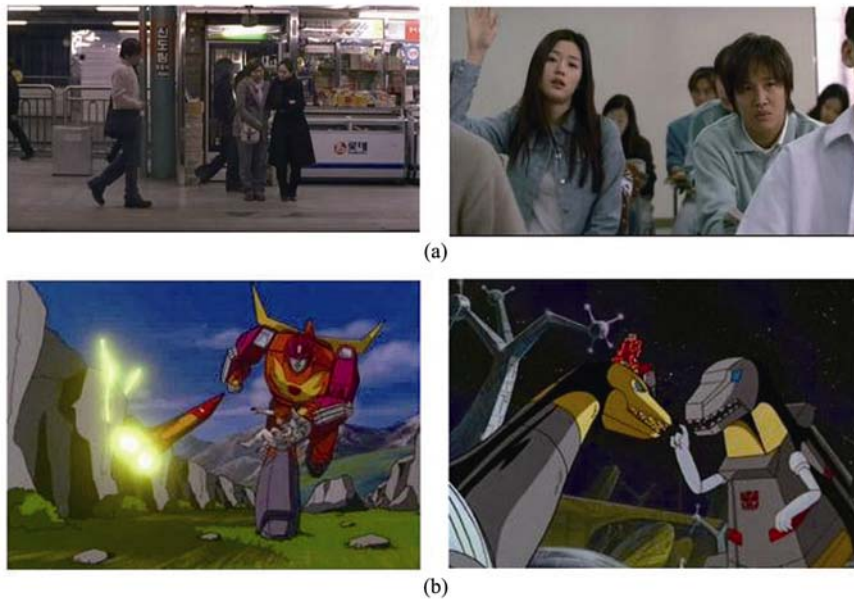
图1 本研究中使用的电影和卡通片段中截取图像 (a) 电影片段中的图像, (b) 卡通片段中的图像

将这些抽取后的图像随机呈现. 电影和卡通片段以及对应的静息图片在两段扫描中是正立的, 在另外两段扫描中是倒立的, 并且4个扫描的顺序在被试之间平衡. 实验要求被试观看电影、卡通或静息图像, 保持头不动.